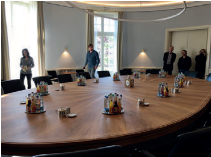
Empfang für Gäste im Rundsaal des Erdgeschosses

Ministerialdirigent Werner Schempp, Leiter der Abteilung Europapolitik und Internationale Angelegenheiten, führte die Delegierten des Kammerbezirks Stuttgart engagiert und bestens informiert durch das Anwesen und erläuterte die Geschichte des Hauses ebenso wie die Organisation des Ministeriums und die Abläufe, für welche die verschiedenen Räume zur Verfügung stehen. Der Empfang der Gäste findet im Rundsaal des Erdgeschosses statt. Wöchentliche Besprechungen der Landesregierung werden im Ovalsaal im 1. Obergeschoss abgehalten.