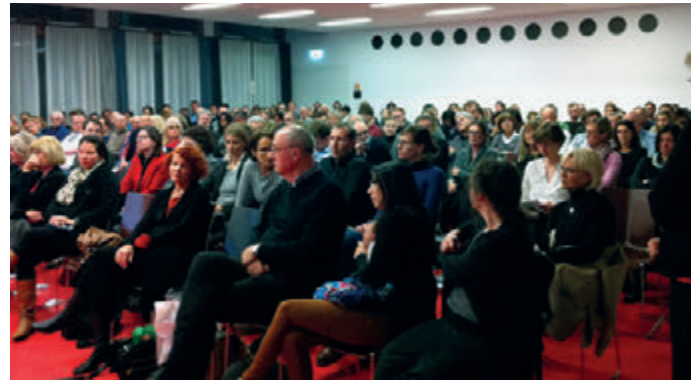
Blick in den Veranstaltungssaal im Hospitalhof Stuttgart