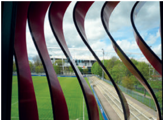
VfB Nachwuchsleistungszentrum Stuttgart

U nter dem Motto „Integration durch Innenarchitektur – ein Zukunftstraum?“ standen die diesjährigen Zukunfts(t)räume der anderen Art in Stuttgart. Aus aktuellem Anlass nahm der BDIA-Landesverband Baden-Württemberg zum Thema, ob und wie weit Innenarchitektur zur Bewältigung der aktuellen und künftigen Herausforderungen an die Integration der anerkannten Flüchtlinge und Migranten beitragen kann.