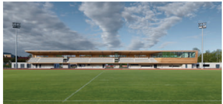
Ausgezeichnet beim Beispielhaften Bauen: Au-Stadion Balingen | ZOLL Architekten Stadtplaner, Stuttgart

So mancher Vortrags- oder Diskussionstermin wird wohl in diesem Monat mit EM-Spielen kollidieren. Die Redaktion wünscht dennoch allen Veranstaltern zahlreiche Teilnehmer – und den Fußballern natürlich viel Erfolg.