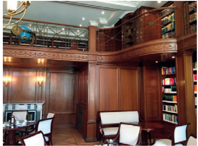
Repräsentativ: die historische Bibliothek