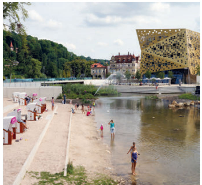
Schwäbisch Gmünd im Sommer 2014

Weitere Informationen: www.forum-stadt.eu