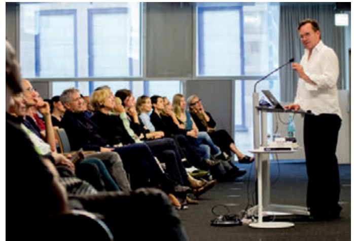
© Thierry Gschwind / Architekturforum Freiburg

Auch für den sozialen Wohnungsbau hat Brandlhuber viele Ideen. Warum nicht auf Bestandsgebäude ein Penthaus bauen unter der Maßgabe, dass die gleiche Fläche darunter für 6,50 Euro pro Quadratmeter vermietet werden muss? Das ist keine Fantasterei, sondern ein Gesetzesvorschlag, der gerade in Berlin eingebracht wird nach Brandlhubers Motto: „Warum machen wir