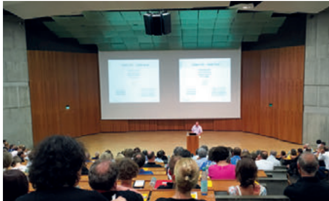
Vorlesungsfeeling im Tiefenhörsaal der Universität Stuttgart