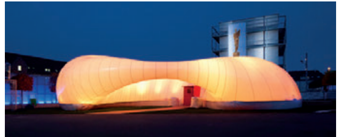
Raumwelten Pavillon, Ludwigsburg (Akademiehof)

Ganz getreu dem diesjährigen Motto und Schwerpunkt des Kongresses wird Raumwelten noch stärker in der Region Stuttgart erlebbar sein. Der Raumwelten-Pavillon „Lichtwolke“ öffnet bereits am 10. November seine Drehtür mit einem vielfältigen