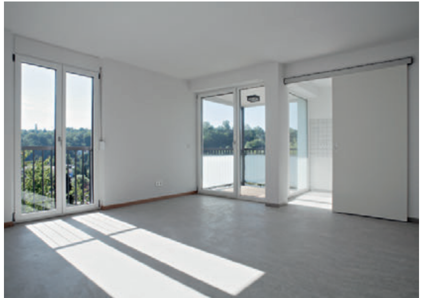
Geförderter Wohnbau in Pforzheim, ausgezeichnet beim Beispielhaften Bauen SWS Architekten, Strolz|Weisenburger|Scheidel, Karlsruhe

Die Wohnraum-Allianz hat konsultative und beratende Funktion und soll zunächst zügig Leitlinien für die verstärkte Schaffung von bezahlbarem Wohnraum erarbeiten. Die Architektenkammer